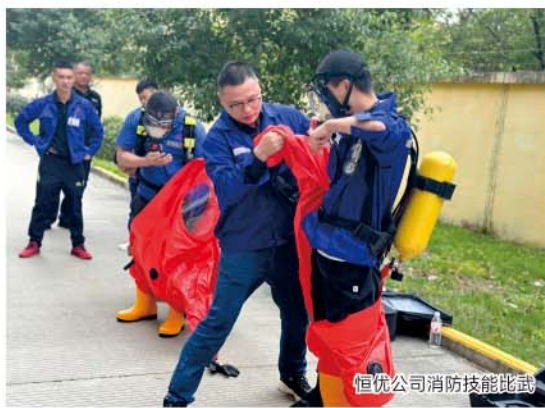
恒优公司消防技能比武

工掌握和熟悉灭火器的使用方法，进一步提高员工“防患于未然”的安全意识，提升厂区消防安全能力。