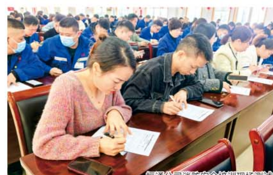
恒通公司消防安全培训现场测试

成绩来之不易，本次比武嘉通公司消防队虽与前三名失之交臂，但也打破了去年的失利，取得了新的突破，充分展现了队员一年来刻苦训练的成果。接下来，嘉通消防队将以此为新的起点，不断提升技能水平，为筑牢企业安全生产防线贡献更大力量。