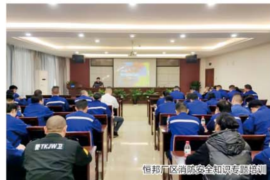
恒邦厂区消防安全知识专题培训

然而，消防安全的重点工作，不是仅仅凭一天就可以宣传到位的。今年11月是第八个全国“消防宣传月”，主题是“全民消防 生命至上”。让我们一起来看看，这个消防月里，桐昆人又有哪些“安全动作”——