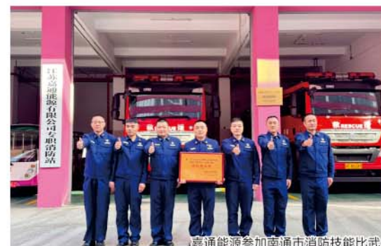
嘉通能源参加南通市消防技能比武

比赛当日，赛场上气氛紧张而激烈。队员们在各个单项项目中展现出了精湛的技巧和强劲的身体素质。两人五盘水带连接环节，他们凭借日常无数次周而复始练习铸就的肌肉记忆，动作行云流水，争分夺秒间实现精准操作，水带似灵动蛟龙，飞速延展就位；6×10米折返跑赛道上，他们化身猎豹全力冲刺，挑战身体极限，风驰电掣间扬起尘土；原地着装佩戴空气呼吸器时，从最初动作生疏到如今每个步骤都经千锤百炼，只为实战能快人一步、抢占先机。消防车两支泡沫枪灭火操项目更是一场默契大考验——驾驶员操控消防车精准、迅速抵达指定点位，水枪手紧密呼应，双手稳稳掌控泡沫枪，泡沫喷射有力、落点精准，整个过程一气呵成。