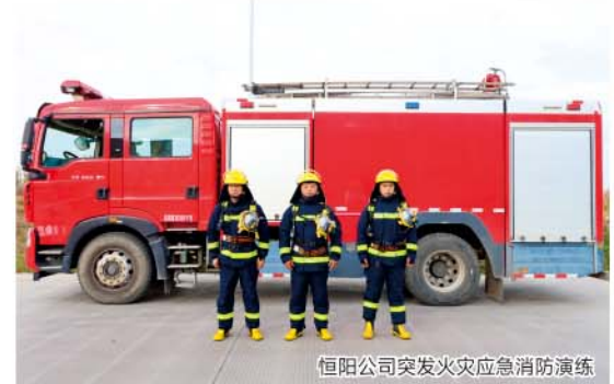
恒阳公司突发火灾应急演练

演练开始了——偌大的广场上，汇聚了近百名员工，厂区安全员正在为大家详细讲解灭火器和消防水带的使用方法。在解说灭火器使用步骤时，安全员着重强调了灭火器的不同的类型以及它们各自的适用范围，边讲解边演示：拿起灭火器，拔掉保险销，对准火焰根部，按下压把，整套动作一气呵成。而在消防水带使用环节，安全员更是从消防水带的展开、连接、消防栓到水枪的握持和喷水角度等，每一个细节都不放过。在场员工都聚精会神地聆听着，认真学习每一个动作要领。讲解结束后，就是新工们的实操演练了。他们略显紧张但也十分认真，一组又一组拎起灭火器向前冲，一个个健步如飞，十分灵活。再来看看水带场地，相较灭火器要更难些，特别是水带的连接，好在通过安全员的指导，大家都能顺利完成整个演练过程。