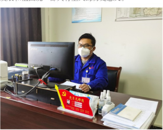
观党的二十大开幕会后，我的心情十分激动，先有国后有党，只有国家富强，人民才能安居乐业，只有国家昌盛，人民才能幸福生活。我党一

党的二十大是在全党全国各族人民迈向全面建设社会主义现代化国家新征程、向第二个百年奋斗目标进军的关键时刻召开的一次重要会议。大会为新时代新征程举旗定向，以马克思主义中国化时代化新境界指引方向，对于党和国家事业构建新发展格局和高质量发展，对于新时代中国特色社会主义现代化前途命运，对于发展全过程人民民主与基本利益，对于法治建设、文化建设、绿色发展、安全发展和祖国统一都具有重大的历史意义。